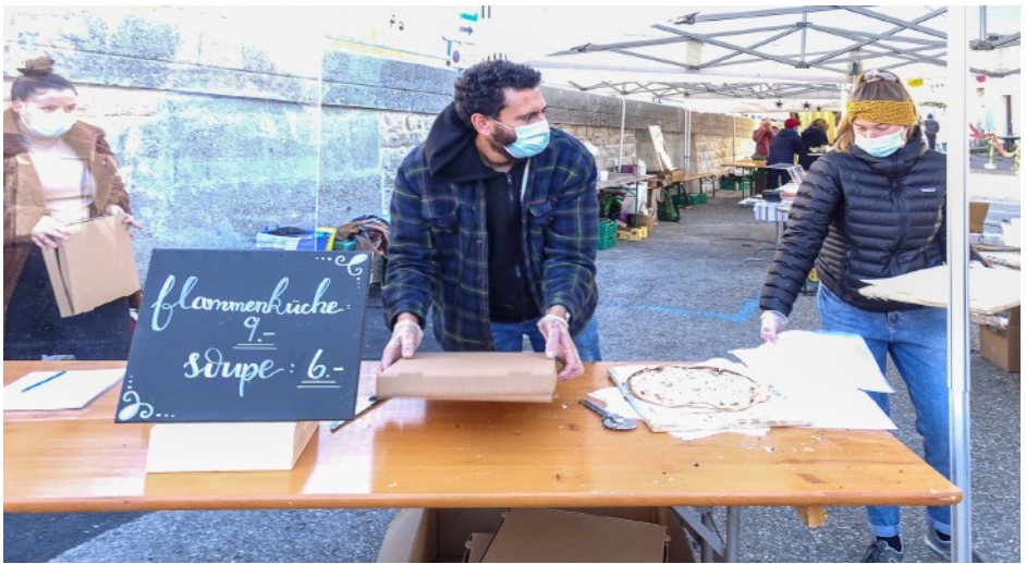
Le bazar à la Place du Marché